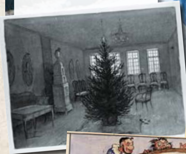
Grantræet Svend Otto S.

TRE EVENTYRLIGE CAUSERIER Tirsdag den 10. december, kl. 16-18 Karen Brahe Auditoriet, Odense Adelige Jomfrukloster, Albani Torv 6 Fri entré