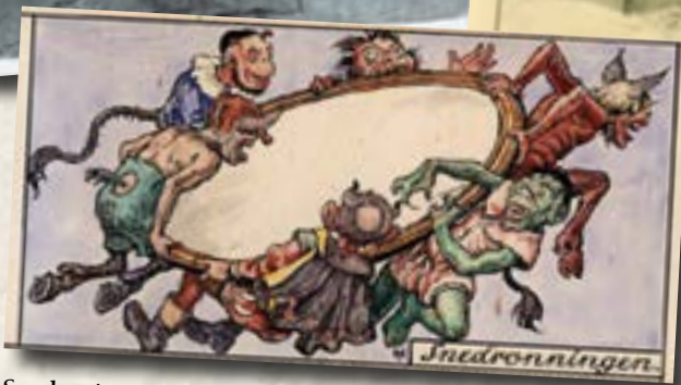
Snedronningen - Hans Tegner