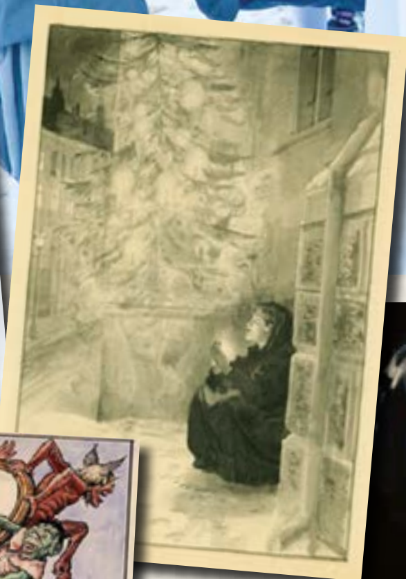
Den lille Pige med Svovlstikkerne Hans Tegner